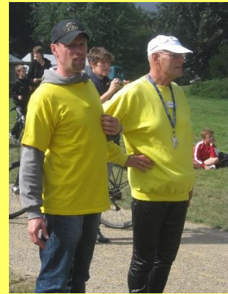
Isola 3-Brücken Lauf 2011