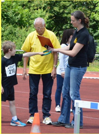
KiLa Sportfest 2016