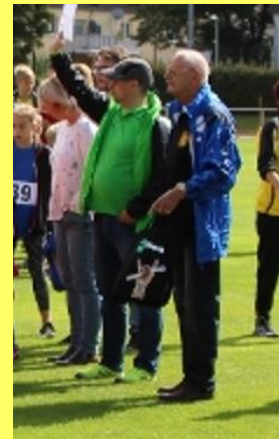
KiLa Sportfest 2017