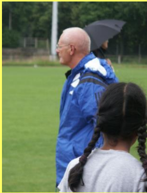
Grundschul- Sportfest 2009 Jülich