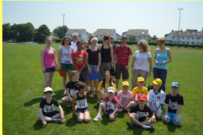
KiLa Sportfest 2013