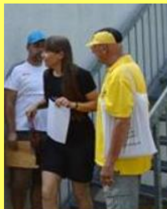
KiLa Sportfest 2015