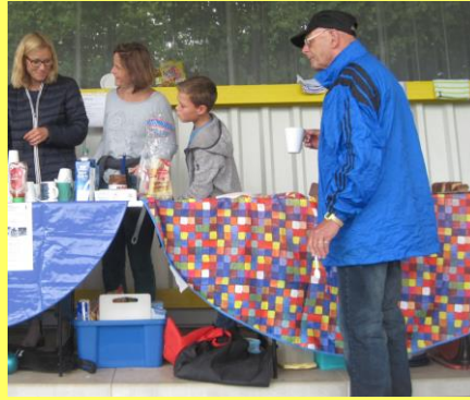
KiLa Sportfest 2017