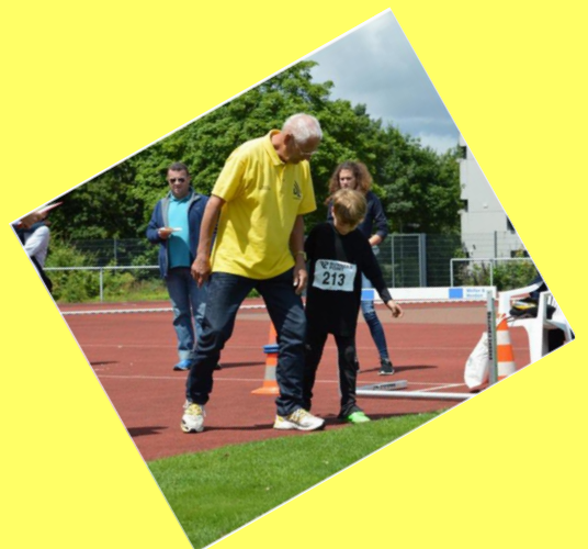
KiLa Sportfest 2016