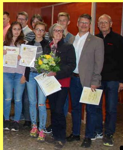
Ehrungen JHV 2019

Für die Kinder- und Jugendgruppen des Birkesdorfer TV